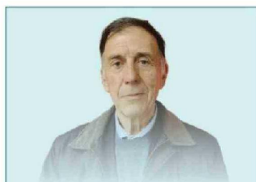
José Leandro Urbina, poeta

"El exilio es como una jaula donde aprendes a decir algunas cosas... y no puedes aprender más porque tienes todo tu pasado en el cual tu lengua es el español"