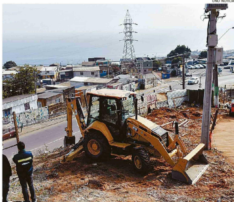
PROCESO SE LLEVÓ A CABO EN PLAYA ANCHA ESTE DÍA MIÉRCOLES A LAS OCHO DE LA MAÑANA.