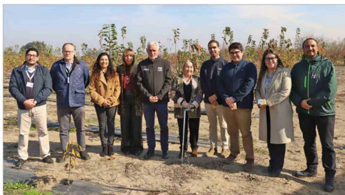
Centro de Estudios Avanzados en Fruticultura entregó su nueva Cuenta Pública.

Con el financiamiento del Gobierno Regional, este centro de investigación desarrolla ciencia e innovación con impacto territorial buscando soluciones para resguardar la seguridad alimentaria en el actual escenario climático. Además, acerca este conocimiento a las nuevas generaciones para continuar su legado.