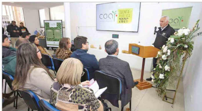
El gobernador regional Pablo Silva Amaya.

ciendo igualmente una reflexión crítica sobre el espacio que ocupa la ciencia: "Sin ella no tendríamos alimentos que determinen nuestra subsistencia. La ciencia es imprescindible para el desarrollo de los países y la única forma de salir del subdesarrollo".