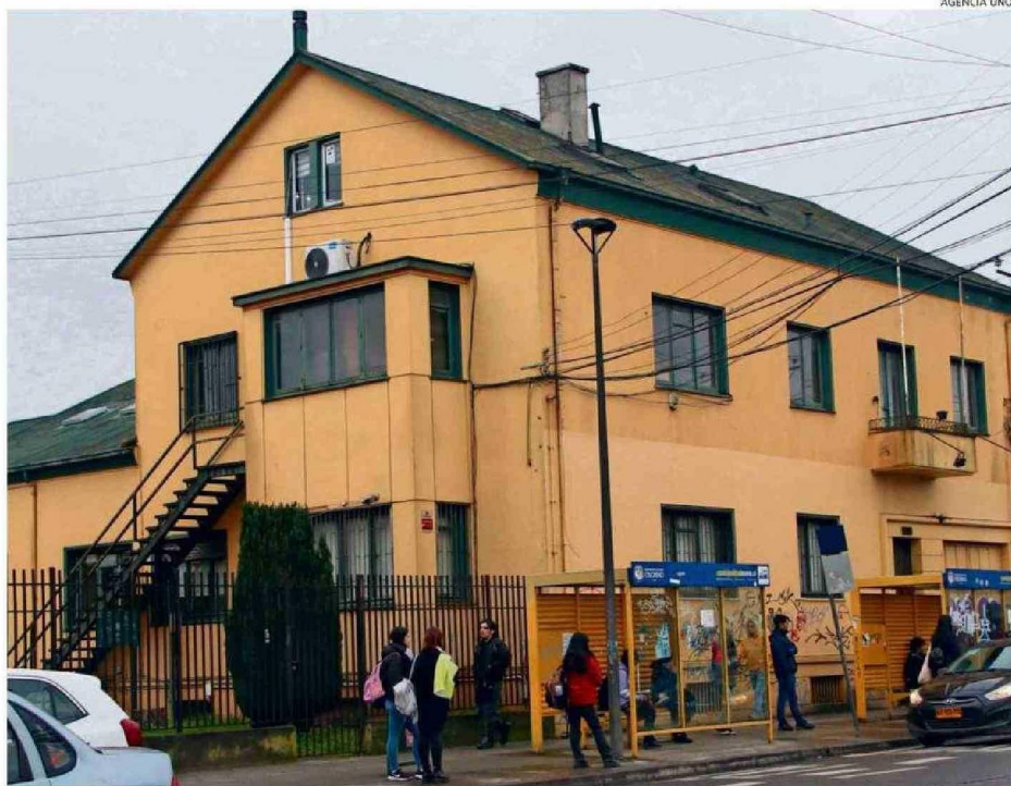
LA CASA CENTRAL DEL IP Y CFT LOS LAGOS SE ENCUENTRA EN LA CALLE LYNCH DE OSORNO. ACTUALMENTE LA INSTITUCIÓN ESTÁ INTERVENIDA.

Con esto se busca acreditar que la Universidad de Los Lagos, ubicada en avenida Fuchslocher, todavía es dueña para efectos laborales y previsionales del IP y CFT Los Lagos, aun cuando los establecimientos fueron