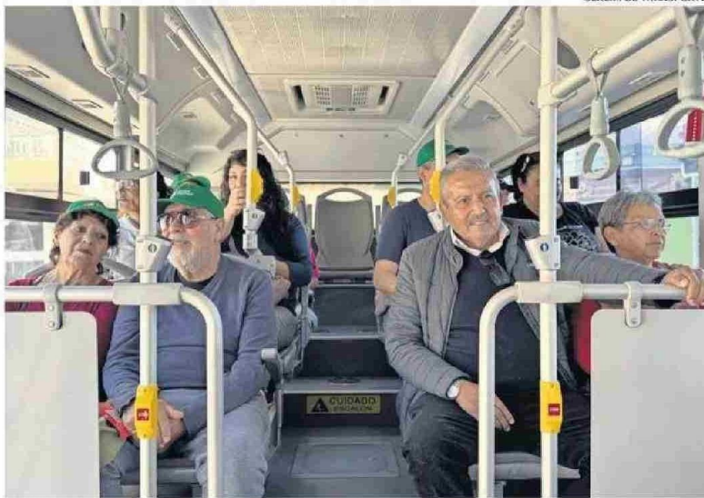
TERCERA EDAD Y ESTUDIANTES TENDRÁN TARIFA PREFERENCIAL.

“Nosotros estamos peleando un subsidio porque la ley así lo dice para aminorar algo lo que va a pasar con los buses, pero lamentablemente