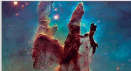
Esta imagen muestra los Pilares de la Creación en el centro de M16, la nebulosa del Águila.

Con una extensión de entre 4 y 5 años luz, los Pilares de la Creación son una característica fascinante, pero relativamente pequeña, de toda la Nebulosa del Águila, que abarca 70 por 55 años luz. La nebulosa, descubierta en 1745 por el astrónomo suizo Jean-Philippe Loys de Chéseaux, se encuentra a 7000 años luz de la Tierra, en la constelación de Serpens. Con una magnitud aparente de 6, la Nebulosa del Águila puede observarse con