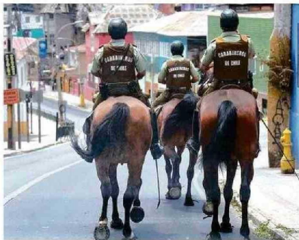
LOS CARABINEROS MONTADOS HAN APOYADO LOS OPERATIVOS.