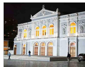
Así luce hoy el remozado Teatro Municipal de Iquique, en la Plaza Arturo Prat.