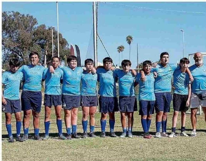
CON LA CATEGORÍA M14 PARTICIPANDO DE UN AMISTOSO CON OLD NAVY EN VIÑA DEL MAR.

“Gracias al ambiente de respeto, apoyo y compañerismo, los niños con y sin discapacidad desarrollan mayor autoestima, motivación y sentido de pertenencia al equipo. Reforzamos positivamente los comportamientos deseados, lo que genera que los niños se sientan valorados y animados a repetir esas conductas. Este refuerzo