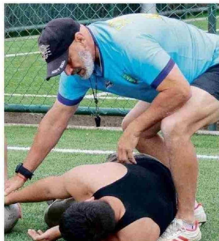
EL ENTRENADOR QUIERE QUE EL RUGBY SEA MUCHO MÁS QUE UN TALLER.