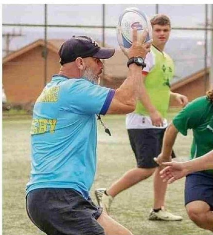
UN ENTRENAMIENTO CON ADULTOS EN EL COMPLEJO JUAN VERA VELÁSQUEZ DE SANTO DOMINGO.