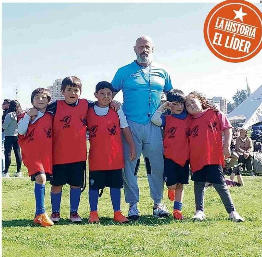
EL DEPORTISTA CON LOS MÁS PEQUEÑOS DE LA ESCUELA EN EL FESTIVAL DE MENORES SPORTING DE VIÑA DEL MAR.