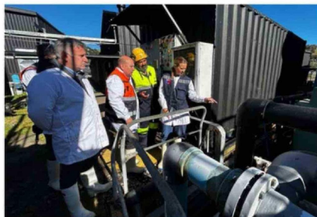
AUTORIDADES CONOCIERON AYER LAS MEDIDAS DE LA EMPRESA.

Unas pericias por presunta infracción a la normativa vigente.