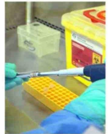
SE INVESTIGAN LOS LUGARES DE RIESGO ASOCIADOS AL CONTAGIO.