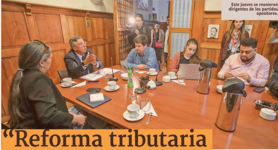
Este jueves se reunieron dirigentes de los partidos opositores.

Si bien admite que "se ha generalizado la idea de rechazar" el proyecto en general entre las oposiciones, explica que también se están evaluando otras medidas, como recurrir ante el Tribunal Constitucional por la inconstitucionalidad de la