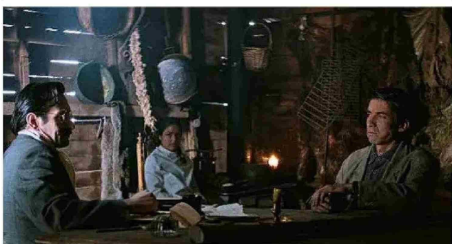
Escenas de “Los colonos”, que fue filmada en la zona más austral de la Patagonia.

“Es una invitación a la reflexión de las personas que vean la película. Es interesante que, además, se plantea una no romantización de lo indígena. Siempre es fácil caer en romantizar a los que sufrieron”.