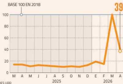
INTERÉS POR PRECIOS DE BENCINAS SE DISPARARON DURANTE EL MES