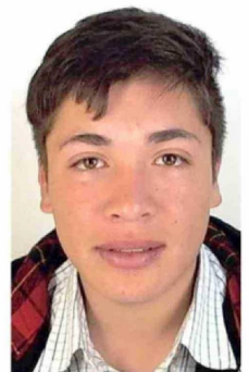
EL CONDENADO DE 29 AÑOS ES ORIGINARIO DE PURRANQUE.

"Manifestamos nuestra preocupación. Estamos en coordinación con ambas policías