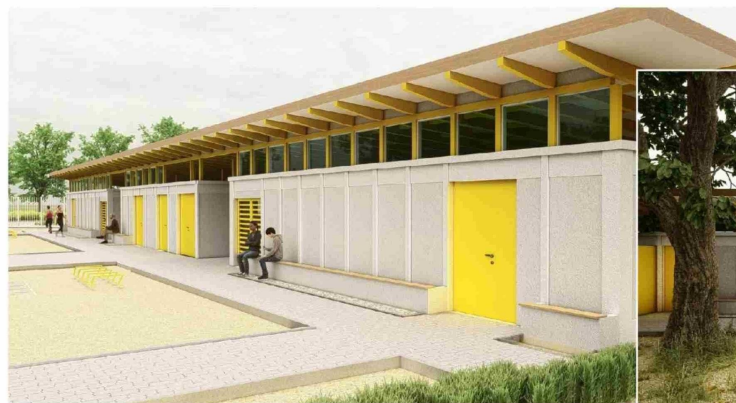
LA PROPUESTA CONTEMPLA camarines para árbitros y jugadores, una bodega para insumos e incluso una enfermería