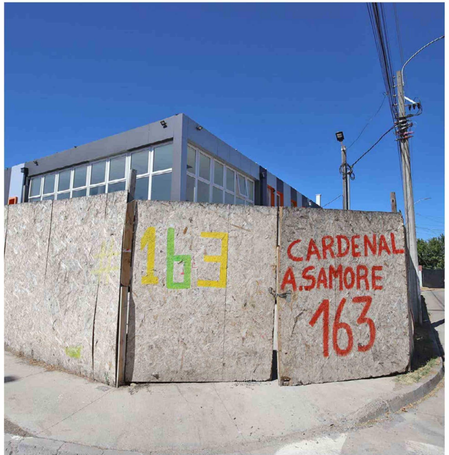
Obras con años de retraso, contratos terminados y avances desiguales marcan la situación de salas cuna y jardines infantiles JUNJI en la Región de O'Higgins.

Posteriormente, en diciembre de 2023, El Rancagüino