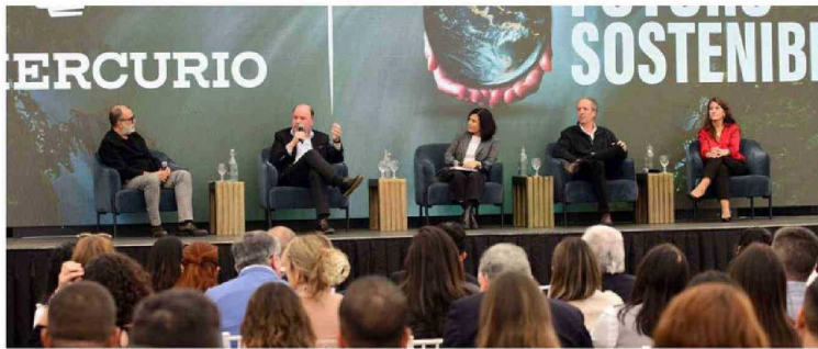
Durante el panel "Empresas y comunidades: compromiso y valor compartido" del summit se sostuvo que el mayor aporte de las organizaciones radica en su capacidad de resolver problemas.

En esa línea, Alfredo Moreno coincidió en que falta que la sociedad general entienda este concepto y mire a las em-