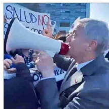
El presidente José Antonio Kast usó un megáfono en Temuco para dialogar con manifestantes en el frente de un hospital, los que reclamaban contra eventuales rebajas presupuestarias en el sector de la salud.

• En Renovación Nacional advierten que la “pretensión de gobernar todo desde el Segundo Piso y la hemos conocido en gobiernos anteriores y no resulta bien”. • A privados les preocupa que las diferencias entre legisladores y asesores impacten en el trámite de la “ley miscelánea” y en el “ambiente para la recuperación económica”.