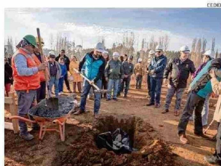
PARTIERON LAS OBRAS DE SISTEMA SANITARIO EN SAN IGNACIO.

zo, alcalde de San Ignacio, aseguró que "es un día histórico para la localidad de San Miguel, ya que tenemos la primera piedra de un proyecto tan anhelado como es el alcantarillado. Sin duda, esto nos da paso para seguir progresando y la verdad es que la comunidad lo esperaba hace años, no hay nada más incómodo que no tener lo básico que es un alcantarillado, así que estamos felices por este proyecto que va en directo