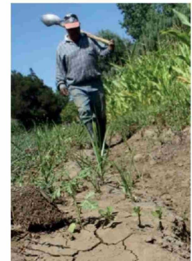
DESDE FEDEFRUTA LLAMARON a imitar el ejemplo de Perú, que cuenta con políticas de desarrollo agrario a 20 o 25 años.

potenciar este crecimiento se requiere un diálogo más fluido y coordinado con otros ministerios, de modo que se puedan agilizar las inversiones y la inyección de recursos necesarios para la renovación del sector. La meta es clara: lograr que la agricultura chilena sea vista no solo como una tradición, sino como un motor de innovación tecnológica que sustenta el desarrollo de gran parte del territorio nacional.