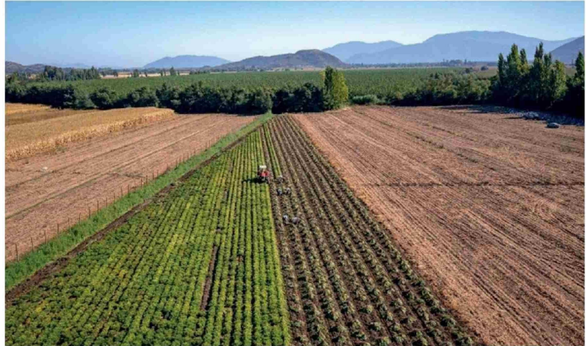
EL SECTOR AGRÍCOLA ES EL SEGUNDO RUBRO con mayor importancia económica, solo después del cobre. Por ello, gremios llaman a destapar su desarrollo.

El representante de Fedefruta observó también el modelo de desarrollo de países vecinos. Catán cita frecuentemente el