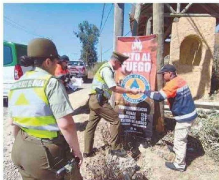
SE PROHIBE REALIZAR ASADOS DURANTE LAS OLAS DE CALOR.