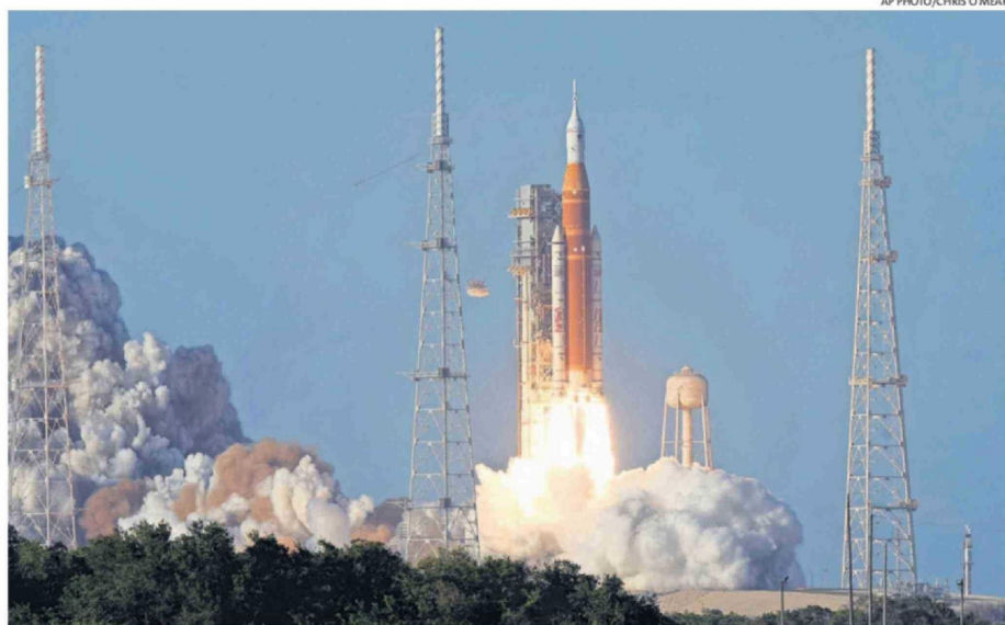
EL DESPEGUE OCURRIÓ SEGÚN LO PREVISTO, PASADAS LAS 19:30 HORAS EN CHILE.

Nasa mantuvo una transmisión ininterrumpida del último amanecer sobre la Tierra de los tripulantes.