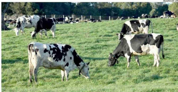
LOS FERTILIZANTES SON CLAVE PARA EL RENDIMIENTO DE LAS PRADERAS, BASE DE LA PRODUCCIÓN LECHERA.

de los fertilizantes, a nivel mundial, transita por el estrecho de Ormuz, lo que ha provocado que ya se esté viendo cierta escasez de estos productos en el mercado.