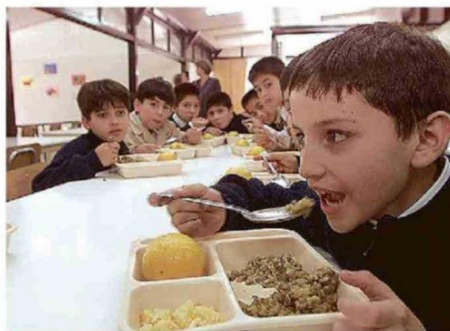
MÁS DE 167 MIL ESTUDIANTES RECIBEN ALIMENTACIÓN DIARIA A TRAVÉS DE JUNAEB EN LA REGIÓN.

El alza sostenida en el precio de los alimentos también aparece como uno de los principales focos de preocupación dentro de las comunidades educativas. Desde los gremios advierten que mantener presupuestos similares en un escenario inflacionario podría traducirse en menos raciones, reducción de porciones o una mayor pre-