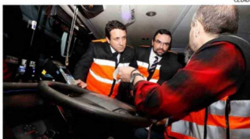
SE ACTIVÓ EL PLAN NACIONAL DE FISCALIZACIÓN AL TRANSPORTE INTERURBANO DE PASAJEROS.

2.000 controles de fiscalización a nivel regional. Nuestro deber principal es resguardar la seguridad de todas las personas que viajarán en estos días, por lo que