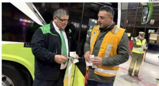
SE EXTREMA EL CONTROL PARA LOS BUSES INTERURBANOS.