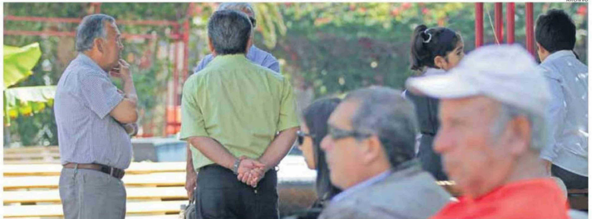
ESPECIALISTAS ADVIERTEN QUE EL AUMENTO SOSTENIDO DE ADULTOS MAYORES EXIGIRÁ AJUSTES URGENTES EN POLÍTICAS PÚBLICAS, INFRAESTRUCTURA URBANA Y APOYO SOCIAL.

Según el investigador del Centro de Política Públicas de la Universidad San Sebastián (USS) y exministro de Economía, Hugo Lavados, este indicó que, "los datos demográficos ya desde hace tiempo estaban indicando que la tasa de natalidad va en descenso y, por otro lado, las personas están viviendo más años, que es el proceso de la longevidad. Entonces, si uno junta los dos procesos, hay cada