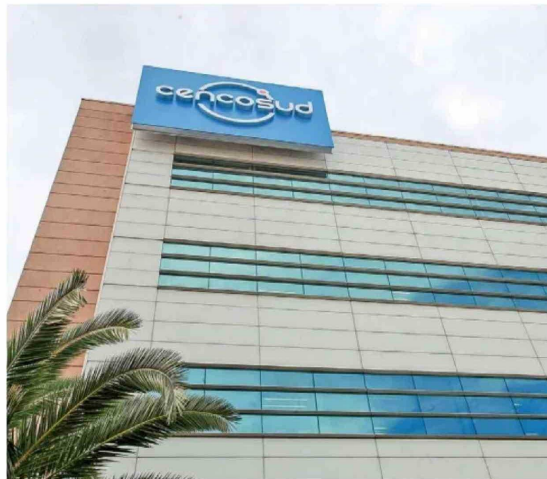
Acción de Cencosud

"La acción puede continuar presionada un tiempo. Es una historia