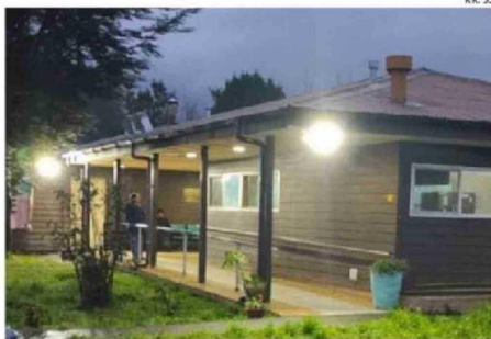
ALBERGUE DISPUESTO EN LA COMUNA DE QUELLÓN.

A ello se suman los dispositivos del Plan Calle, que operan por un periodo aproximado de 140 días durante el invierno.