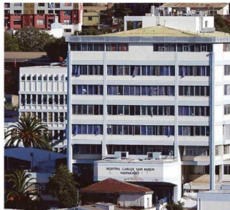
NUOVO HOSPITAL ES UNA DE LAS GRANDES DEUDAS DE LA ZONA.