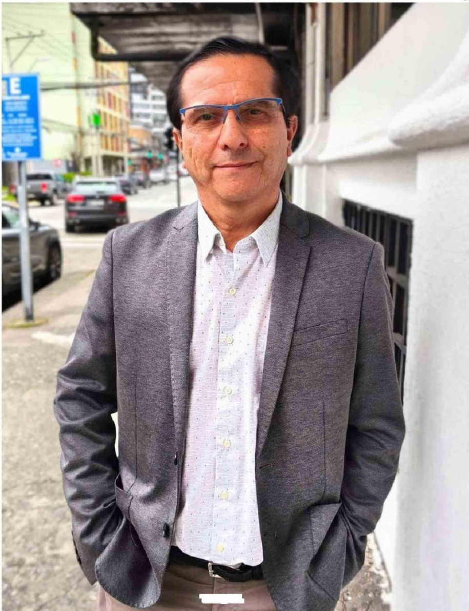
DÍAZ ES PROFESOR Y HA SIDO RECTOR EN 4 COLEGIOS, 3 DE ELLOS CATÓLICOS, PERTENECIENTES A LA CONGREGACIÓN DE LOS HERMANOS MARISTAS.

EDUCACIÓN PARTICULAR. En su paso por Los Lagos, Díaz abordó la crisis de convivencia: apoya el uso de detectores de metales, pero advierte el peligro de exponer a los profesores a inspecciones manuales.