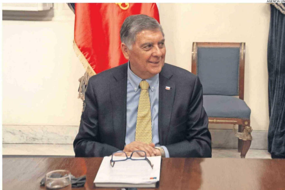
EL JEFE DE GABINETE TAMBIÉN RECONOCIÓ QUE HAY UN PLANO HUMANO EN ESTE CASO.