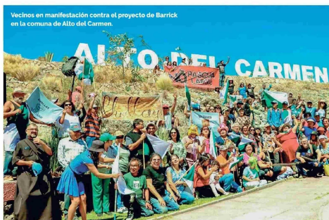
Vecinos en manifestación contra el proyecto de Barrick en la comuna de Alto del Carmen.

El 19 de marzo de este año, Barrick ingresó al Servicio de Evaluación Ambiental el proyecto denominado "Prospección Minera El Alto", y que busca volver a explorar la zona, con nuevas tecnologías y medidas de cuidado, para ver cuánto mineral hay. La empresa, lo ha dicho por todos lados, no es la misma que hace 20 años, y hace tiempo que vienen conversando con cuanta junta de vecinos y organización quiera hablar para explicarle lo que quieren hacer, algo que confirman en la zona.