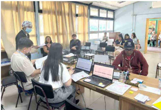
Atenciones gratuitas incluyen tratamientos y prevención.