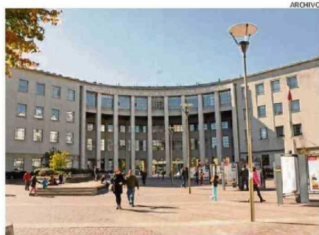
El error fue detectado en el Séptimo Juzgado Civil de Concepción.

“La comprensión para aprobar (un examen) se aplica al trabajo. Pero las IA no son humanos estudiando para sus carreras.”