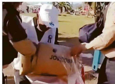
VENDEDOR AMBULANTE SIENDO DESPOJADO DE SUS PRODUCTOS

Según la autoridad policial, el día de la detención, el vendedor intentó evitar el decomiso force-