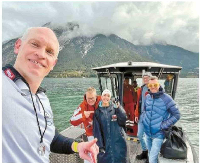
Equipo de apoyo (observador, médico, apoyo logístico).