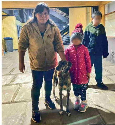
UNA FAMILIA DE VICTORIA logró reencontrarse con su mascota que se encontraba desde hace meses desaparecida gracias al chip de identificación detectado durante el registro de los canes rescatados.

Asimismo, las condiciones del lugar —marcadas por hacinamiento, acumulación de desechos y presencia de parásitos— representaban un riesgo sanitario relevante, con potencial de propagación de enfermedades tanto entre animales como hacia humanos.