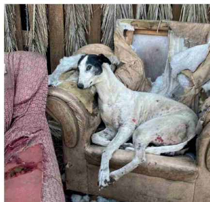
SEGÚN PATITAS LA, los responsables del canil están identificados y serán demandados penalmente por el delito de maltrato animal.

Además, la rápida respuesta de la comunidad permitió reunir apoyo logístico y recursos para el cuidado de los animales, evidenciando una red de colaboración clave en este tipo de emergencias.