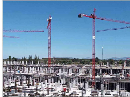
LA EVIDENCIA MUESTRA. — que los recursos destinados a inversión pública incrementan el PIB en mayor proporción que otros tipos de gasto público.

“Es esperable que la ejecución de la inversión pública al cierre de 2025 presente un aumento importante respecto al dato reportado en noviembre, pero, de todos modos, distaría de una ejecución completa en base a los recursos aprobados inicialmente para 2025, lo que extendería la tendencia de subejecución de la inversión pública”, advierte.