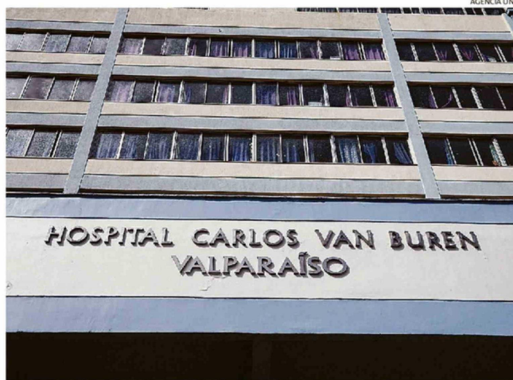
LA SIGUIENTE SEMANA ES CLAVE PARA SABER LA POSICIÓN DEL GOBIERNO ANTE SU UBICACIÓN.

Según antecedentes del Servicio de Salud Valparaíso-San Antonio, ya existe una promesa de compraventa de uno de los terrenos aledaños al recinto, mientras otros paños siguen en evaluación debido a diferencias en los valores solicitados.