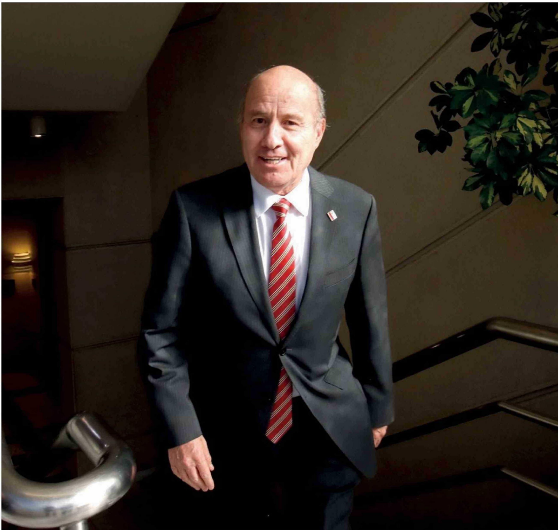
► Ministro de Hacienda, Jorge Quiroz.