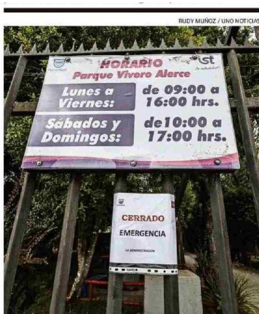
AYER EL RECINTO MUNICIPAL SE MANTUVO CERRADO TRAS EL ATENTADO.

Título: Cinco focos simultáneos confirman intencionalidad de incendio forestal