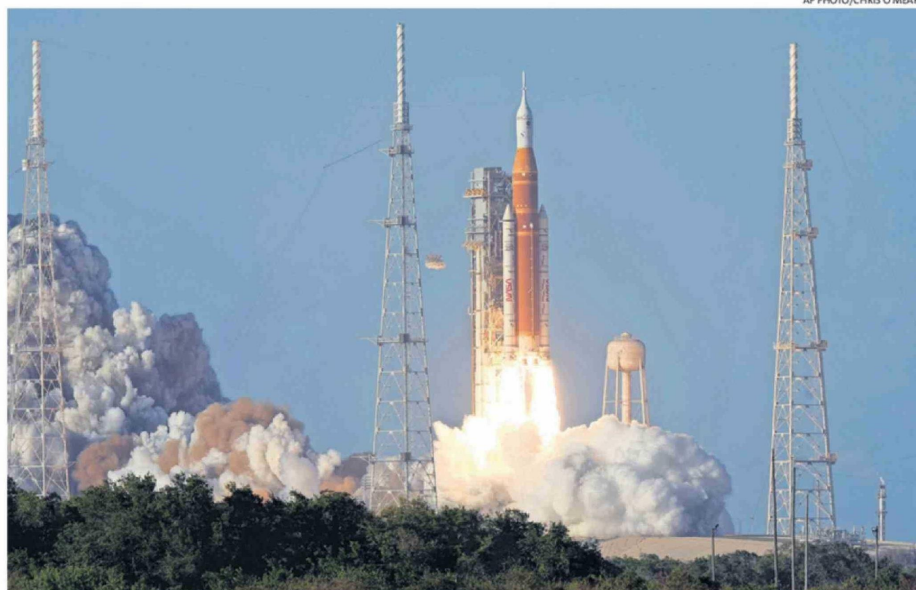
EL DESPEGUE OCURRIÓ SEGÚN LO PREVISTO, PASADAS LAS 19.30 HORAS EN CHILE.

Desde la madrugada la Nasa mantuvo una transmisión ininterrumpida del último amanecer so-