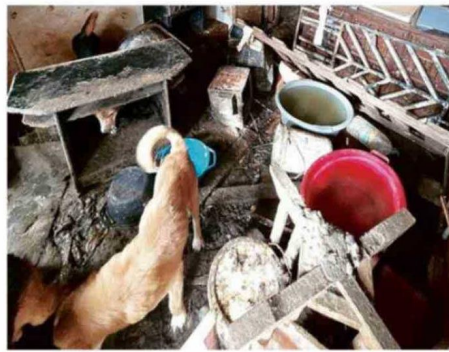
ASÍ VIVÍAN ADENTRO LOS ANIMALITOS.