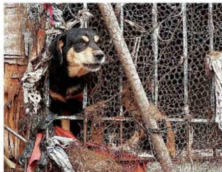
LOS PERROS SOLO PODÍAN ASOMARSE POR LA VENTANA.