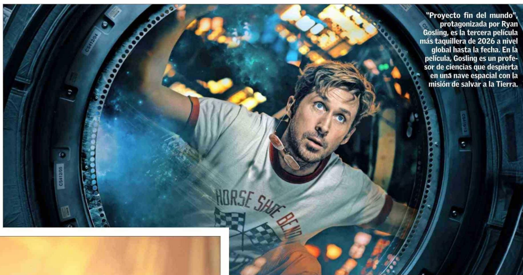
"Proyecto fin del mundo", protagonizada por Ryan Gosling, es la tercera película más taquillera de 2026 a nivel global hasta la fecha. En la película, Gosling es un profesor de ciencias que despierta en una nave espacial con la misión de salvar a la Tierra.

La película ha sido reconocida por científicos a nivel global por la manera en que aborda diferentes aspectos, algunos reales y otros que, aunque no lo son, están basados en ideas o hipótesis científicas legítimas.