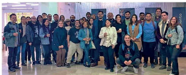
Expositores y asistentes al ciclo de charlas "Propiedad Intelectual, Gestión Colectiva e Inteligencia Artificial", realizado en Corfo entre abril y mayo de 2025.