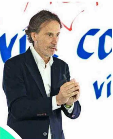
El conferencista Víctor Küppers dictó su charla "Vive con actitud, vive el cuidado" a los presentes.

Este nuevo centro forma parte del "Máster Plan de la Achs", que considera la renovación de 27 centros y la reubicación de otros 13, con la finalidad de unificar la experiencia de atención en todo el país, mejorar la infraestructura, ofrecer espacios más cómodos e inclusivos, y alcanzar altos estándares de sostenibilidad medioambiental.