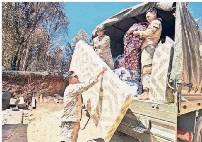
EN EL SECTOR DE ÑIPAS, COMUNA DE RÁNQUIL, SE ENTREGARON COLCHONES.