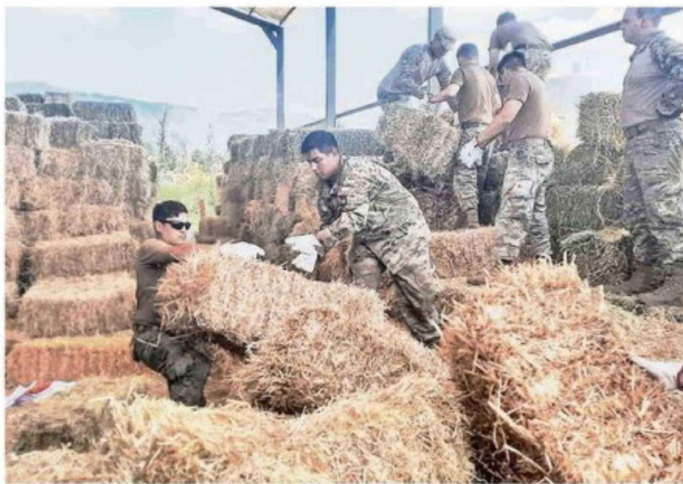
LA ESCUELA DE ARTILLERÍA COLABORÓ EN EL TRASLADO DE FORRAJE.