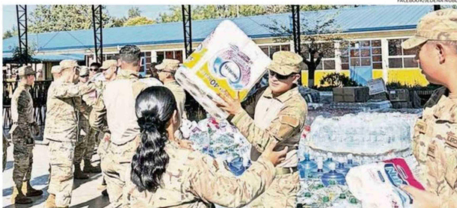
MILITARES COLABORAN EN EL CENTRO DE ACOPIO ORGANIZANDO CAJAS CON AYUDA HUMANITARIA PARA PERSONAS AFECTADA.

En el marco del despliegue de apoyo por los incendios forestales en la Región de Ñuble, personal de la Unidad Fundamental de Emergencias y Catástrofes (UFEC) de la Escuela de Artillería, desplegado en la Jefatura de Defensa Nacional de Ñuble, colaboró en la localidad de Ñipas, comuna de Ránquil, en labores de organización de ayuda humanitaria en el centro de acopio y en el traslado de forraje para animales hacia el sector Vega de Concha, consistente en 250 fardos destinados a personas afectadas. En paralelo, una sección de la UFEC del Regimiento N.º 2 "Maipo" realizó patrullajes preventivos en la comuna de San Fabián, como parte de las acciones de resguardo y apoyo a la población. ☞