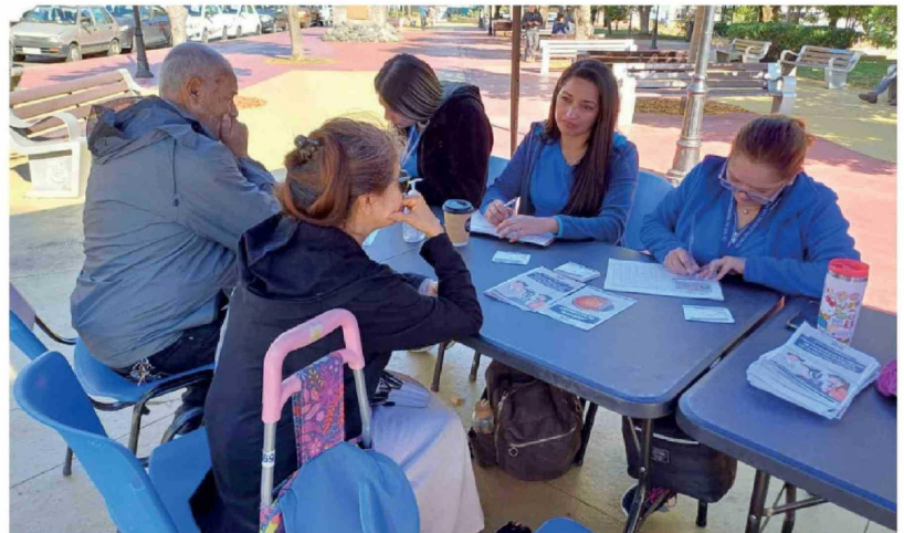
OPERATIVO DE DETECCIÓN PRECOZ del glaucoma realizada en la Plaza de Armas de Los Ángeles.

Con el objetivo de fomentar la detección temprana del glau-