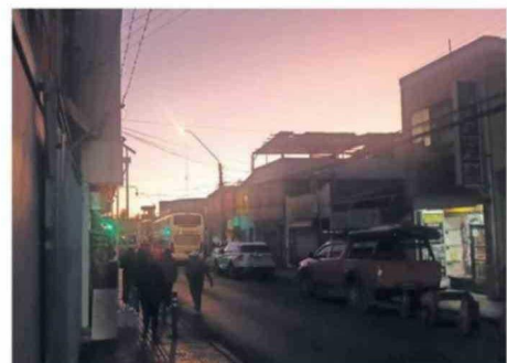
TRAS EL TERREMOTO GRAN PARTE DE CALAMA ESTUVO SIN ELECTRICIDAD.

La autoridad agregó que la principal preocupación se con-